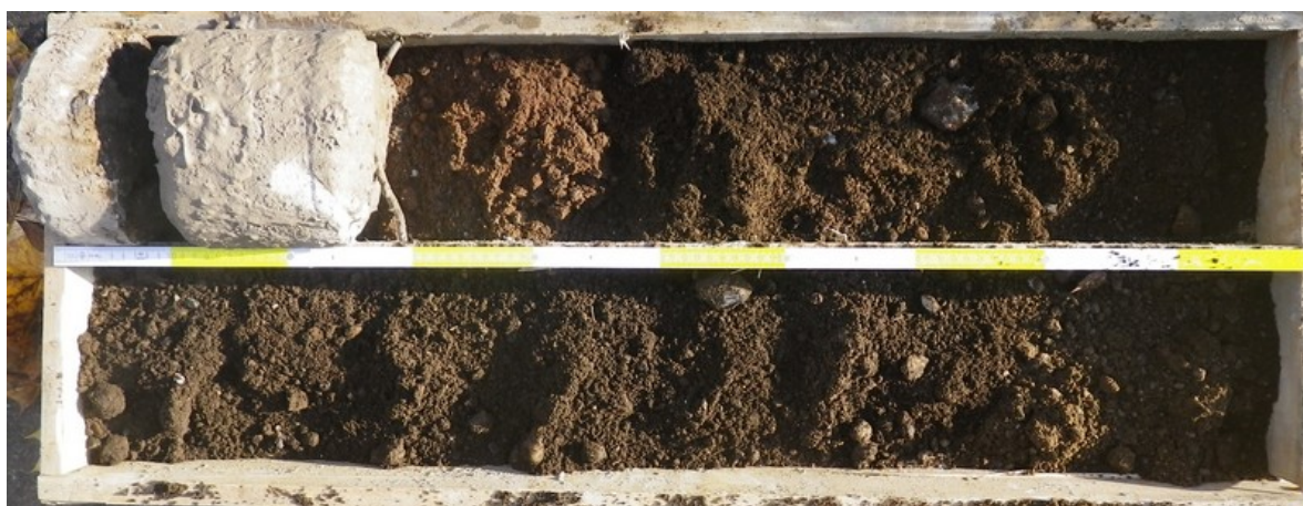
Fotodokumentace vrtného výnosu V-4