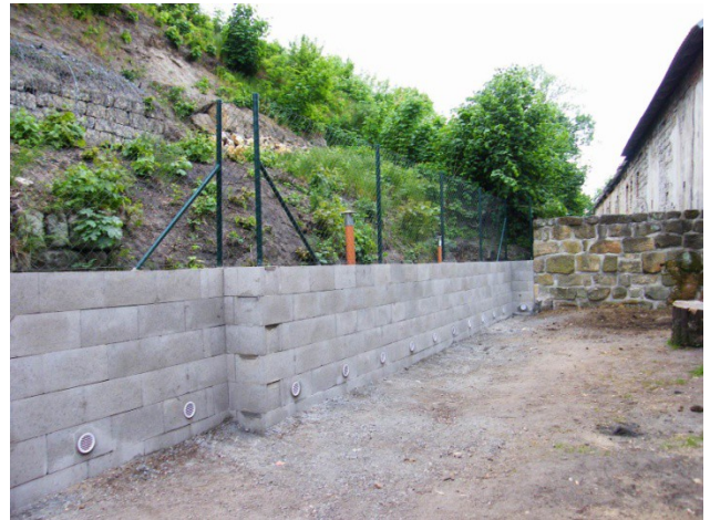
tentýž úsek po realizaci (05/2016)