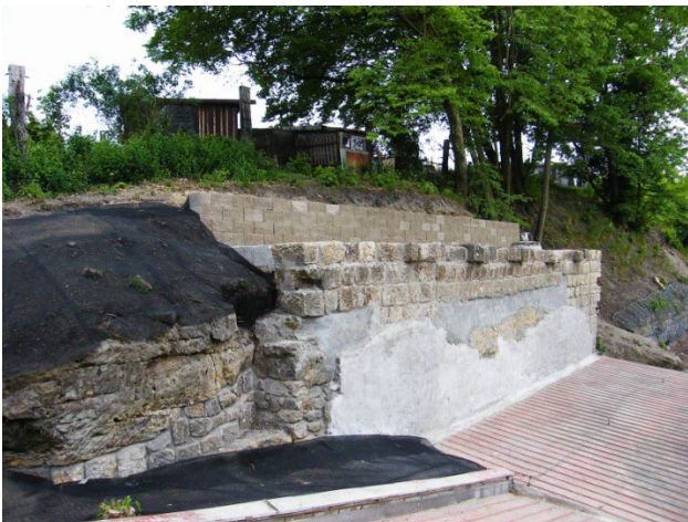
Dokončená stabilizace v horní části svahu