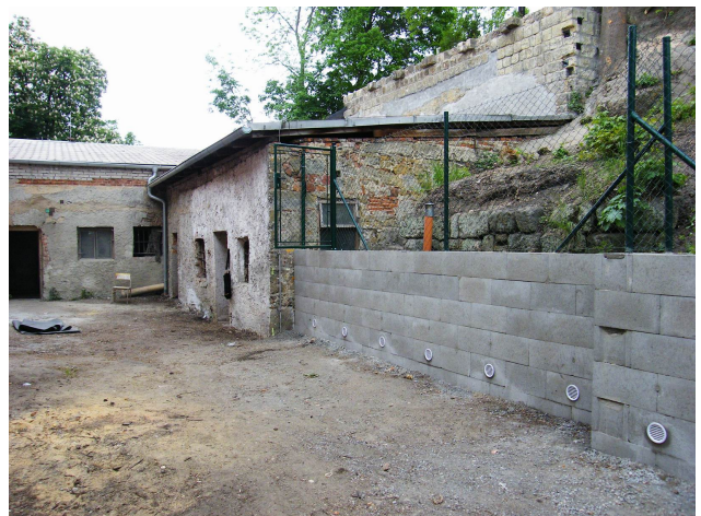
a v patě svahu (05/2016)