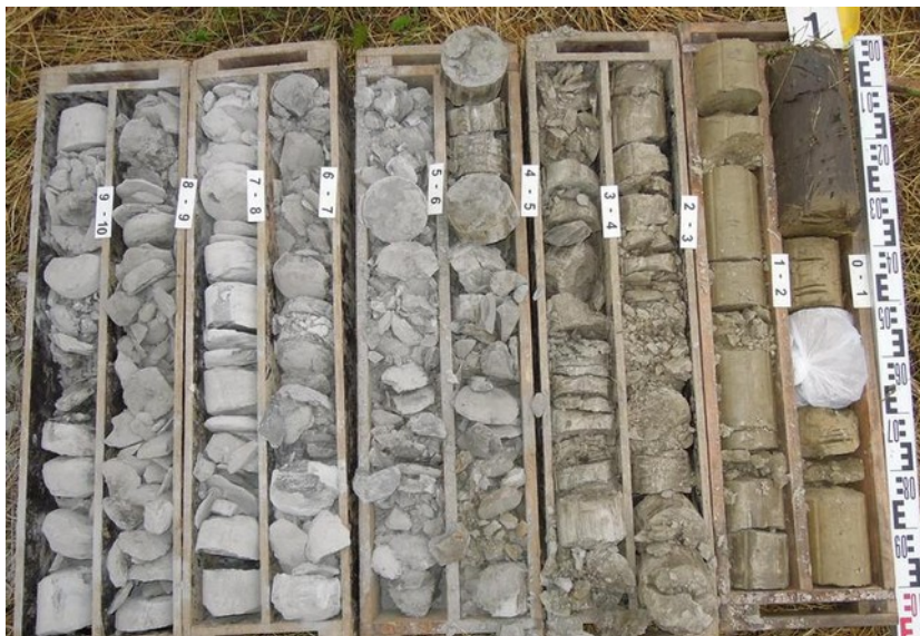
Fotodokumentace vrtného výnosu V-1